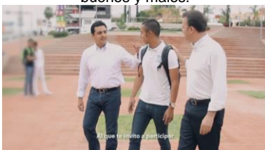
Al que te invito a participar. Quiero cuidar la ciudad para ti.