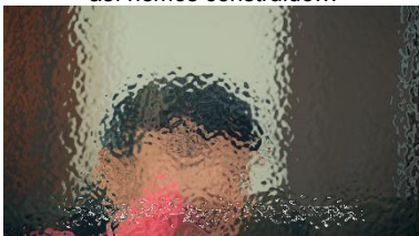
Al igual que tú, he vivido tiempos buenos y malos.