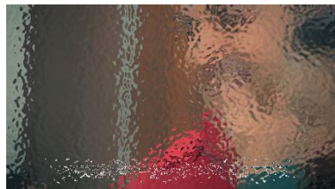
Sin embargo, la vida me presenta un gran reto, un nuevo proyecto.