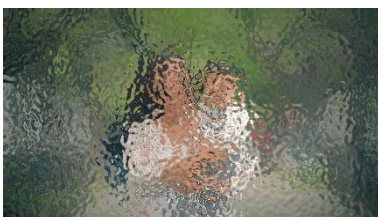
para que tú ganes más.