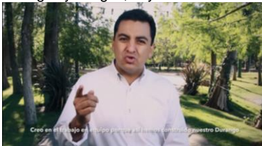
porque así hemos construido...