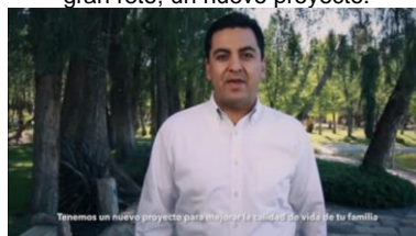
Tenemos un nuevo proyecto para mejorar la calidad de vida de tu familia...