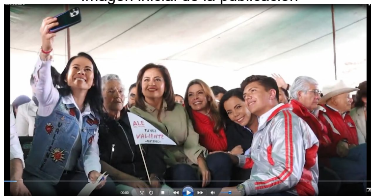
Imagen inicial de la publicación