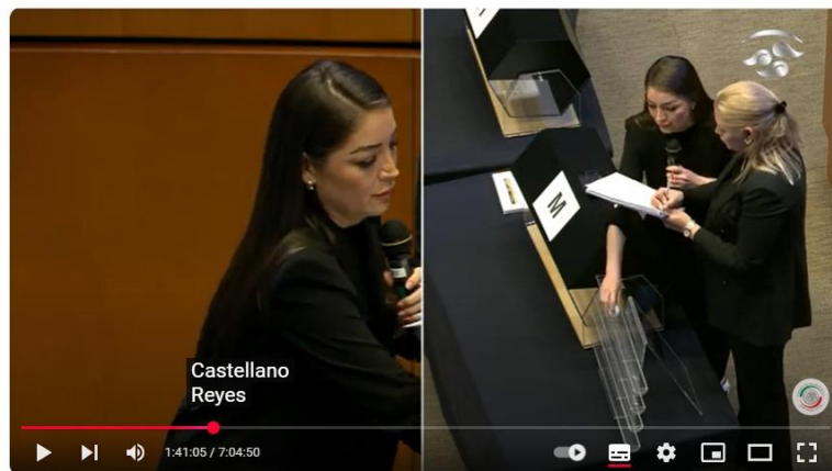
Insaculación pública para determinar las candidaturas a cargo del Poder Judicial de la Federación

Por otro lado, tal como lo menciona el actor, al momento en que se estaba llevando la insaculación para seleccionar las candidaturas para ocupar los cargos del Tribunal Laboral Federal de Asuntos Individuales del tercer circuito, no se muestra la pantalla del Salón, únicamente aparecen las senadoras con lista en mano: