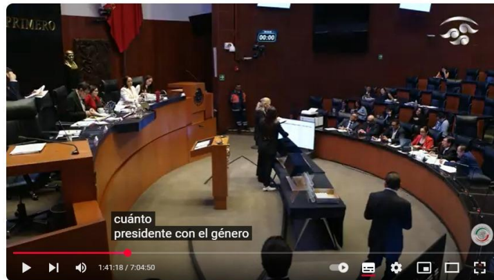
Insaculación pública para determinar las candidaturas a cargo del Poder Judicial de la Federación

Como puede observarse, es cierto que lo que menciona el actor respecto a que no se puede observar la pantalla del salón con la lista de los aspirantes para conocer si verdaderamente el número de esfera seleccionado le correspondía a quienes fueron seleccionados para conformar la lista final. No obstante, se precisa de igual manera, que en ambos momentos, puede apreciarse que hay una pantalla en la cual se proyecta la lista, misma que estaba ubicada frente a los integrantes de la mesa directiva: