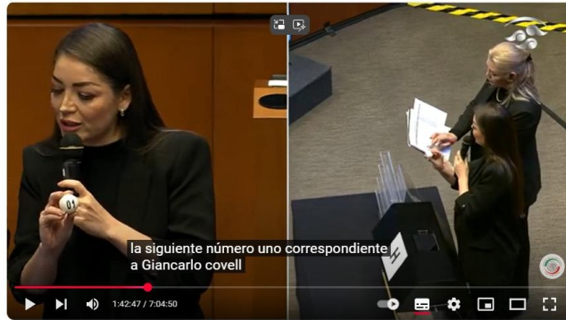
Insaculación pública para determinar las candidaturas a cargo del Poder Judicial de la Federación

Como puede observarse, es cierto que lo que menciona el actor respecto a que no se puede observar la pantalla del salón con la lista de los aspirantes para conocer si verdaderamente el número de esfera seleccionado le correspondía a quienes fueron seleccionados para conformar la lista final. No obstante, se precisa de igual manera, que en ambos momentos, puede apreciarse que hay una pantalla en la cual se proyecta la lista, misma que estaba ubicada frente a los integrantes de la mesa directiva: