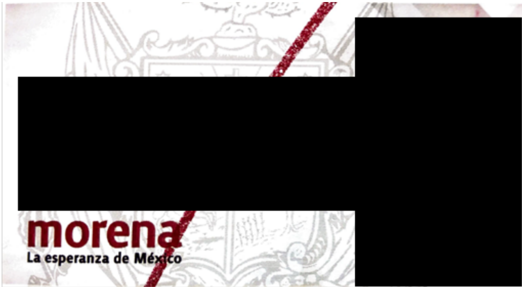
Publicación de 19 de abril de la foto de portada en la red social Facebook del candidato denunciado