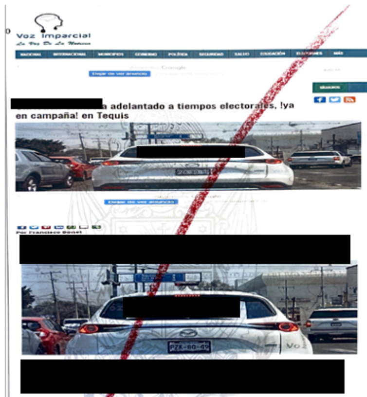
Publicación realizada el 18 de abril en la página web LA VOZ IMPARCIAL