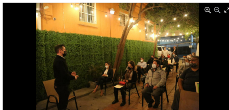
Luis Donaldo Colosio Riojas 23 de febrero · Tenemos una responsabilidad generacional de detonar el surgimiento de nuevos y mejores liderazgos para nuestro País y el mundo.

Tenemos una responsabilidad generacional de detonar el surgimiento de nuevos y mejores liderazgos para nuestro País y el mundo.