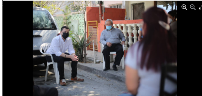
Luis Donaldo Colosio Riojas 23 de febrero · Primero hay que escuchar a la gente. Dialogamos con la ciudadanía para generar estrategias y solucionar sus necesidades.

Primero hay que escuchar a la gente. Dialogamos con la ciudadanía para generar estrategias y solucionar sus necesidades.