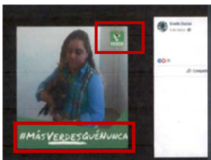
Publicación en Facebook