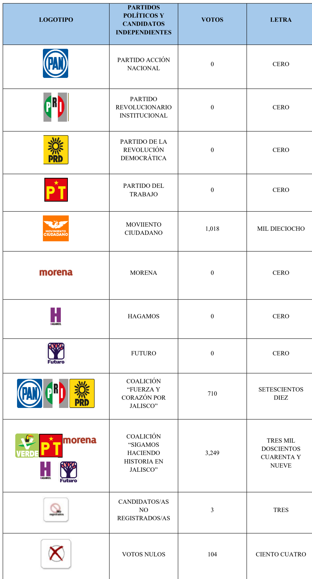
5. Tabla 1: Votación final para el Ayuntamiento de San Juanito de Escobedo, Jalisco