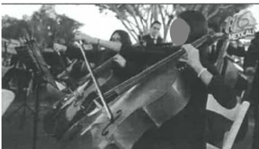
Imagen: se observa una orquesta tocando al aire libre.

Audio: Música regional mexicana de fondo, Voz de Gustavo Sánchez Vásquez en off: "y empezaron a visualizar", en la esquina superior derecha se observa un logo con el texto: "116 Mexicali"