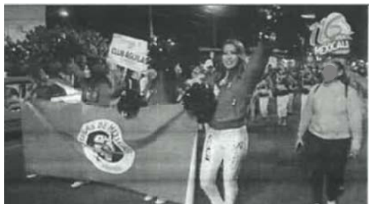
Imagen: se observa un grupo de personas bailando y caminando por la calle, en la esquina superior derecha se observa un logo con el texto: "116 Mexicali"

Audio: Música regional mexicana, Voz de Gustavo Sánchez Vásquez en off: "a los cachanillas"