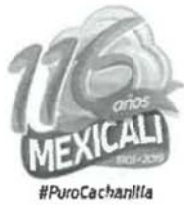
Imagen: se observa un fondo blanco con el texto "116 años MEXICALI, 1903-2019 #PuroCachanilla"