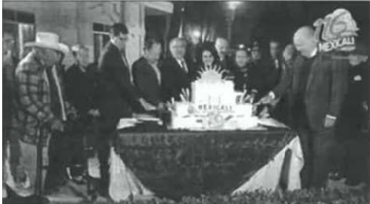
Imagen: se observa un pastel con forma de edificio, con un sol en la parte superior, con la el texto: "Mexicali, 22 ayuntamiento" sobre una mesa con mantel azul marino, en la esquina superior derecha se observa un logo con el texto: "116 Mexicali"

Audio: Música regional mexicana de fondo, Voz de Gustavo Sánchez Vásquez en off: "que algún día, en estas tierras".