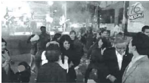
Imagen: se observa a un grupo de personas bailando en una pista, al fondo se observa un escenario con músicos sobre él, en la esquina superior derecha se observa un logo con el texto: "116 Mexicali"

Audio: Música regional mexicana, Voz de Gustavo Sánchez Vásquez en off: "por el bienestar"