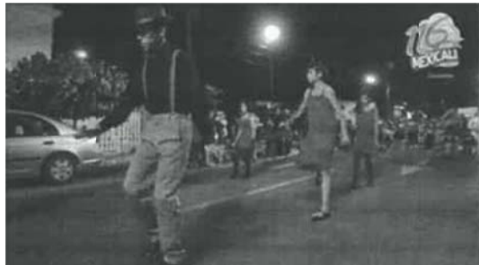
Imagen: se observa un desfile sobre una calle de noche, se observa un grupo de personas desfilando, usando un sombrero blanco, un poliacate rojo y camisa a cuadros, en la esquina superior derecha se observa un logo con el texto: "116 Mexicali"

Audio: Música regional mexicana, Voz de Gustavo Sánchez Vásquez en off: "y el compromiso"