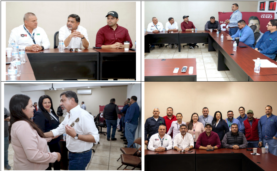
Imagen y descripción del texto inserto en la publicación