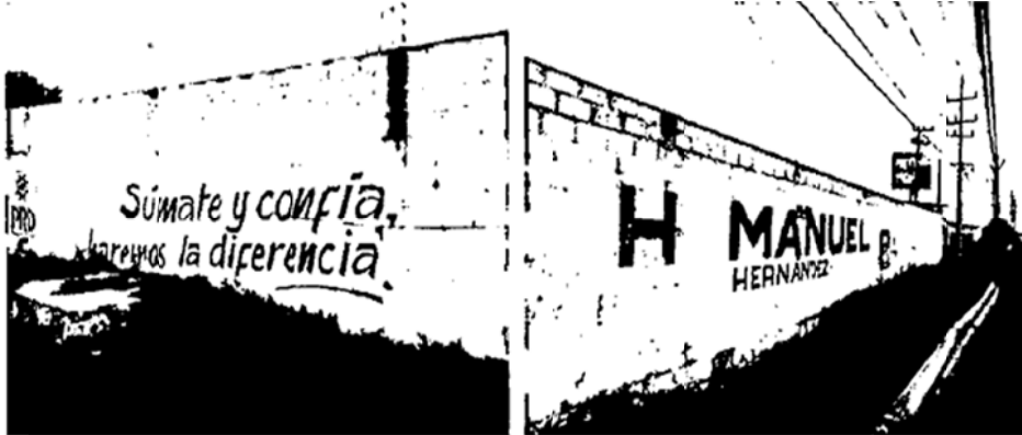
Ubicación: "Carretera Pachuca-Sahagún, Fraccionamiento San Fernando, Mineral de la Reforma, Hidalgo".