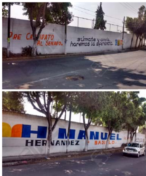
Ubicación: "Autopista México-Pachuca, Colonia Héroes, Ecatepec de Morelos, Estado de México".