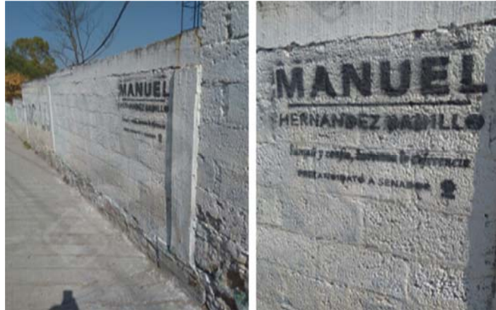
Ubicación: "Calle casa blanca, Colonia San Antonio, Chapantongo, Hidalgo".