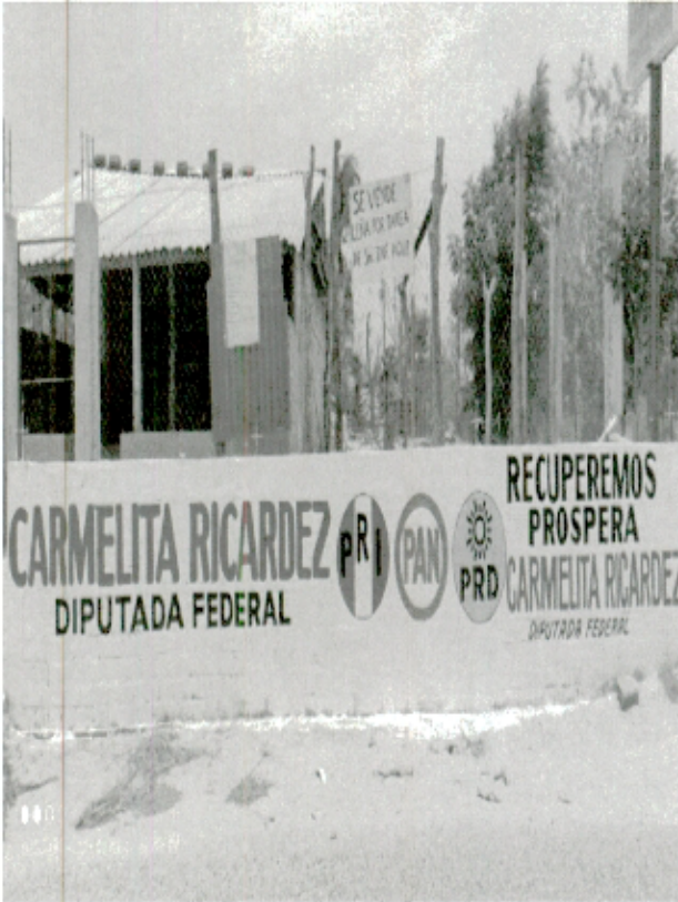
5. Carretera Puerto Ángel-Oaxaca, Calle Tres de octubre, Miahuatlán de Porfirio Díaz (un espectacular).