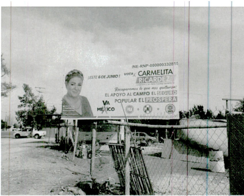
6. Entronque de la Carretera Federal 200 Salina Cruz-Santiago Pinotepa Nacional y la Carretera Estatal 175, Puerto Ángel-Oaxaca, San Pedro Pochutla, Oaxaca (un espectacular).