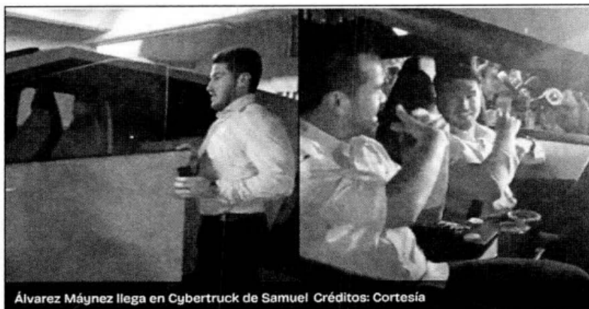
Álvarez Máynez llega en Cybertruck de Samuel

El candidato a la presidencia estuvo conviviendo con simpatizantes en el centro de Monterrey, donde la candidata a la alcaldía regia hizo pegoteo de calcas.