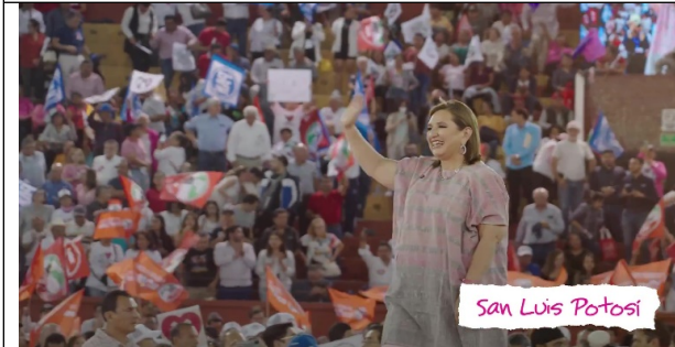
San Luis Potosí