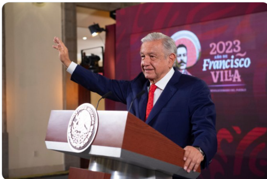
1:43 p. m. · 9 may. 2023 · 14,9 mil Reproducciones

Después de la resolución de la Suprema Corte lo que sigue, dijo el presidente @lopezobrador, es lograr la mayoría calificada en el Congreso para hacer las reformas constitucionales necesarias y completar la transformación del país y del poder judicial. Ese es el plan C.