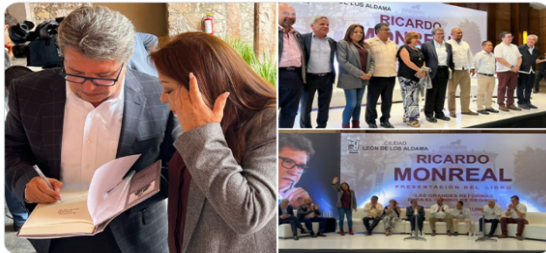
3:53 p. m. · 22 jun. 2022 · Twitter for iPhone