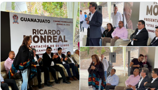
7:08 p. m. · 21 jun. 2022 · Twitter for iPhone