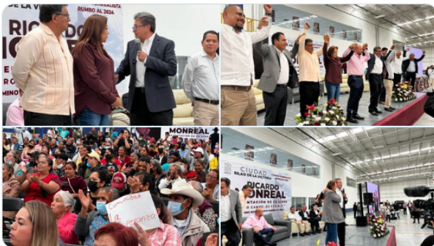
12:12 p. m. · 22 jun. 2022 · Twitter for iPhone

Junto con mis compañeros senadores y nuestro coordinador Ricardo Monreal A., tuvimos la oportunidad de conversar con las y los ciudadanos de Silao, #Gto. Vamos a seguir buscando la transformación de los pueblos de nuestros estados.