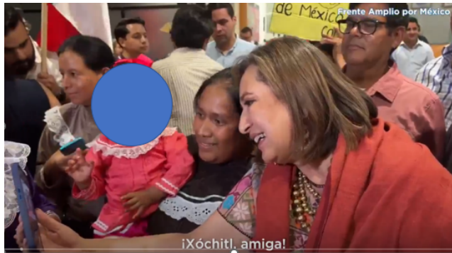
(Publicación identificada con el número 3 en la sentencia)

Me aparto de esta consideración, toda vez que, desde mi punto de vista, las apariciones son incidentales, a excepción de una con la que concuerdo en que su aparición es directa, ya que aparece en primer plano y es enfocada directamente por la cámara, aunado a que la denunciada estaba consciente de que se estaba retratando con una niña: