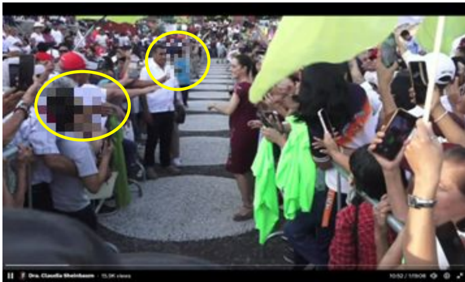
Imagen 18 Minuto 10:48

*Cuyo rostro fue difuminado por esta autoridad y así salvaguardar su imagen.