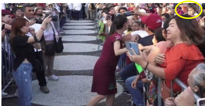
Imagen 23 Minuto 4:10

*Cuyo rostro fue difuminado por esta autoridad y así salvaguardar su imagen.