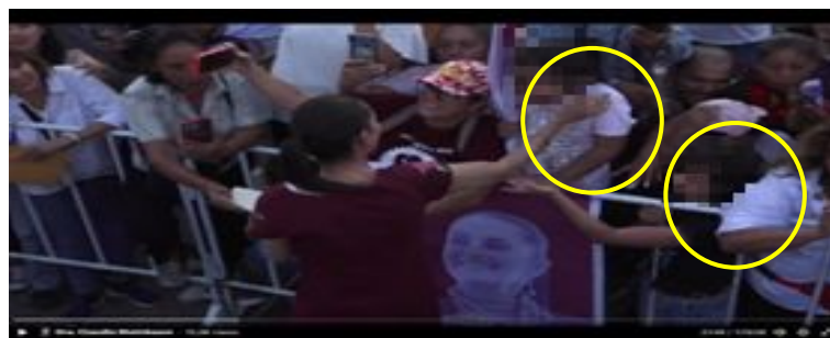
Imagen 19 Minuto 21:46

*Cuyo rostro fue difuminado por esta autoridad y así salvaguardar su imagen.