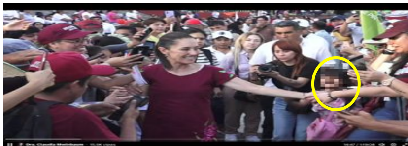
Imagen 12 Minuto 14:47

*Cuyo rostro fue difuminado por esta autoridad y así salvaguardar su imagen.