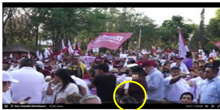
Imagen 7 Minuto 10:17

*Cuyo rostro fue difuminado por esta autoridad y así salvaguardar su imagen.