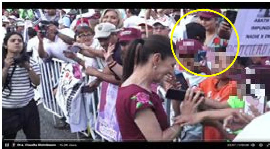
Imagen 13 Minuto 23:57

*Cuyo rostro fue difuminado por esta autoridad y así salvaguardar su imagen.