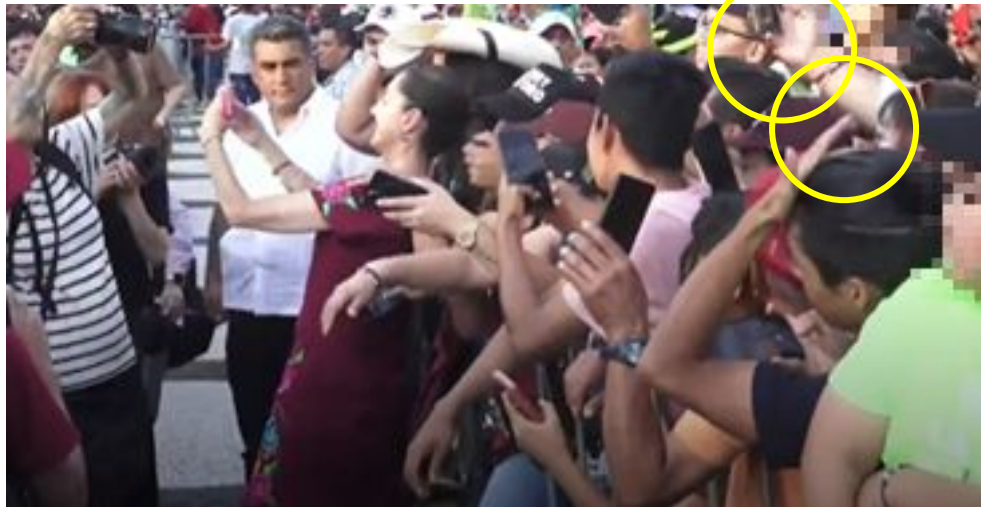
Imagen 27 Minuto 15:16

*Cuyo rostro fue difuminado por esta autoridad y así salvaguardar su imagen.