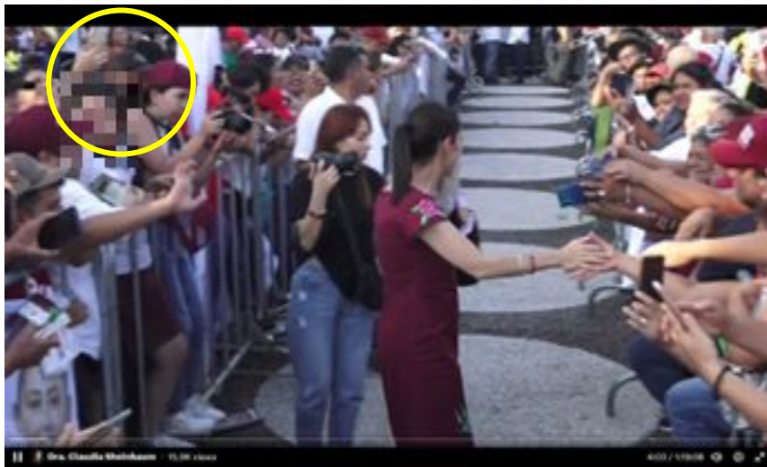
Imagen 4 Minuto 4:03

*Cuyo rostro fue difuminado por esta autoridad y así salvaguardar su imagen.