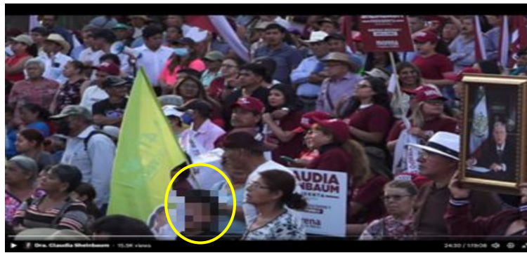
Imagen 21 Minuto 24:30

*Cuyo rostro fue difuminado por esta autoridad y así salvaguardar su imagen.