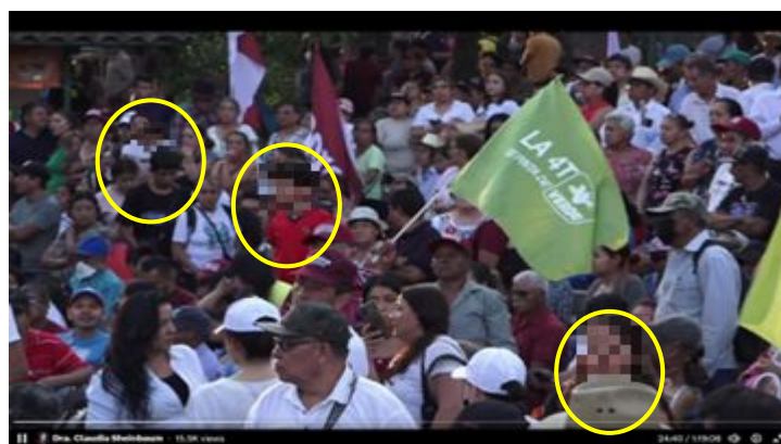
Imagen 22 Minuto 24:40

*Cuyo rostro fue difuminado por esta autoridad y así salvaguardar su imagen.