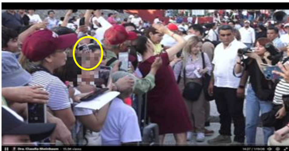
Imagen 10 Minuto 14:21

*Cuyo rostro fue difuminado por esta autoridad y así salvaguardar su imagen.