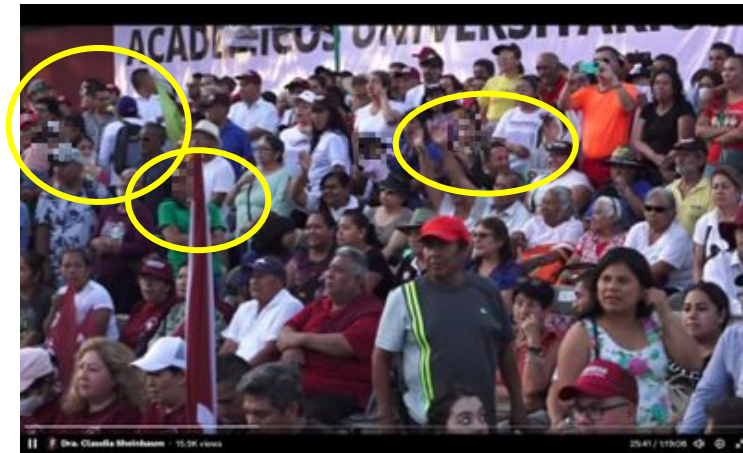
Imagen 14 Minuto 25:41

*Cuyo rostro fue difuminado por esta autoridad y así salvaguardar su imagen.