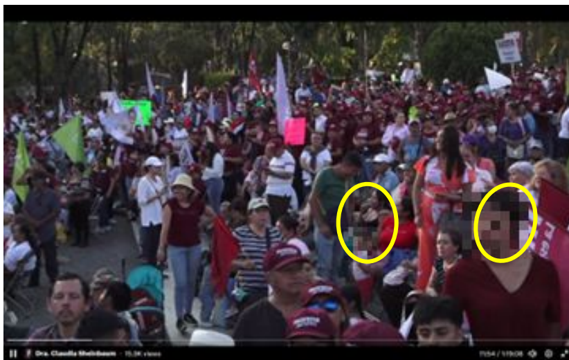
Imagen 8 Minuto 11:54

*Cuyo rostro fue difuminado por esta autoridad y así salvaguardar su imagen.