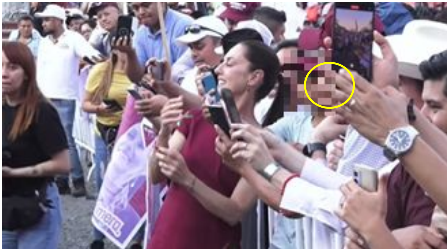
Imagen 30 Minuto 26:43

*Cuyo rostro fue difuminado por esta autoridad y así salvaguardar su imagen.