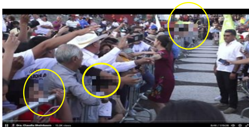
Imagen 17 Minuto 08:46