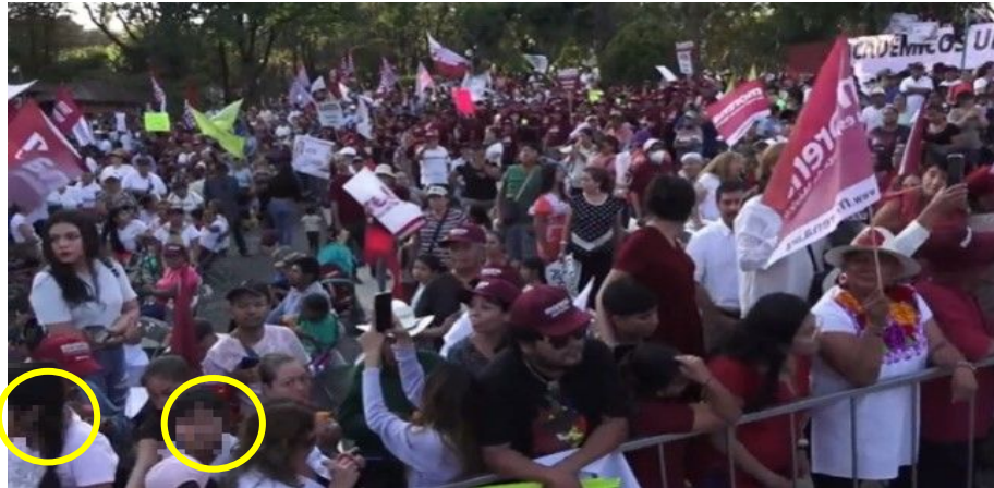
Imagen 24 Minuto 6:41

*Cuyo rostro fue difuminado por esta autoridad y así salvaguardar su imagen.