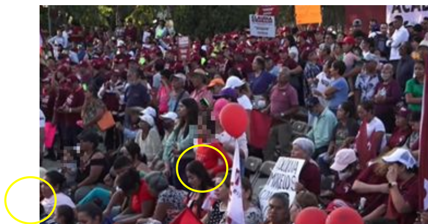
Imagen 29 Minuto 25:45

*Cuyo rostro fue difuminado por esta autoridad y así salvaguardar su imagen.