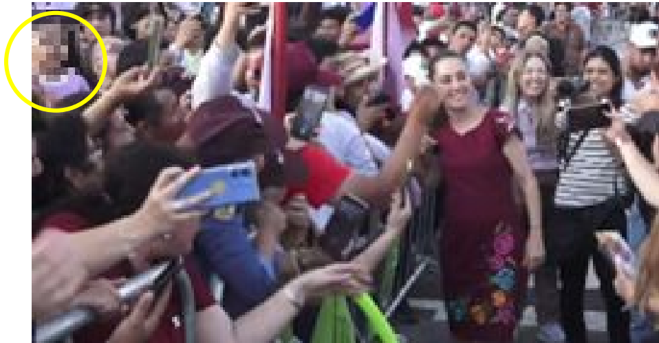
Imagen 28 Minuto 17:00

*Cuyo rostro fue difuminado por esta autoridad y así salvaguardar su imagen.