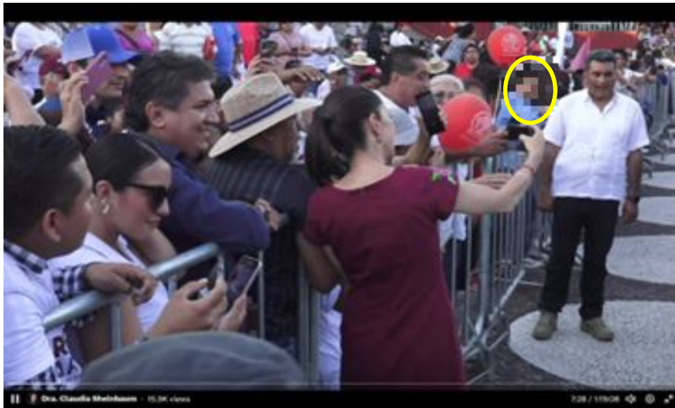
Imagen 5 Minuto 7:28

*Cuyo rostro fue difuminado por esta autoridad y así salvaguardar su imagen.