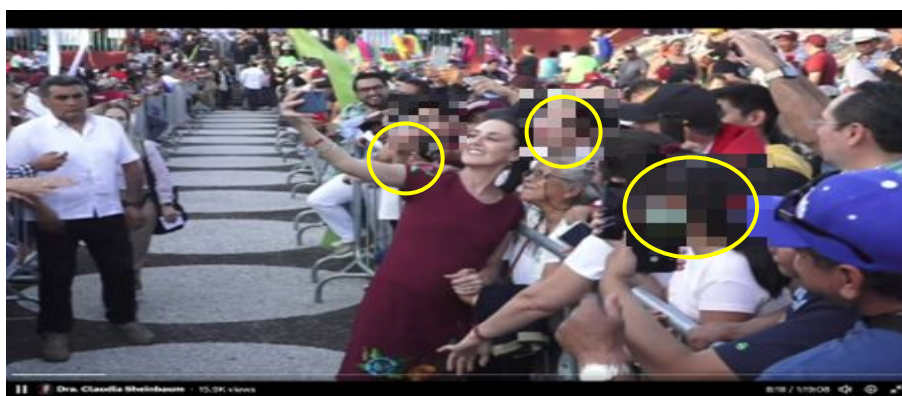
Imagen 6 Minuto 8:18

*Cuyo rostro fue difuminado por esta autoridad y así salvaguardar su imagen.