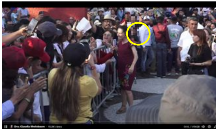
Imagen 15 Minuto 0:10

*Cuyo rostro fue difuminado por esta autoridad y así salvaguardar su imagen.