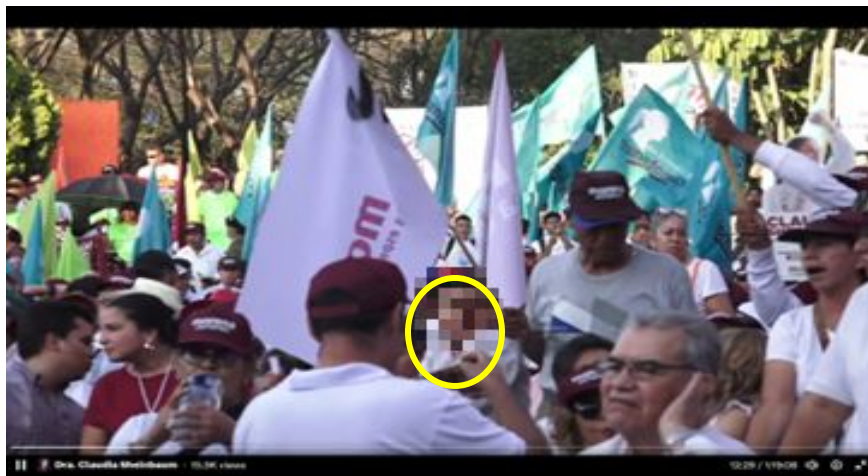
Imagen 9 Minuto 12:29

*Cuyo rostro fue difuminado por esta autoridad y así salvaguardar su imagen.