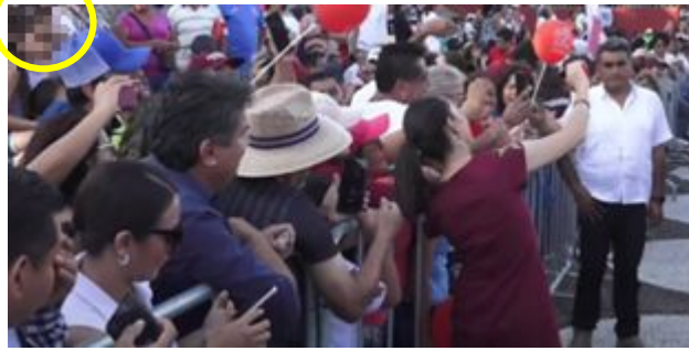
Imagen 25 Minuto 7:10

*Cuyo rostro fue difuminado por esta autoridad y así salvaguardar su imagen.