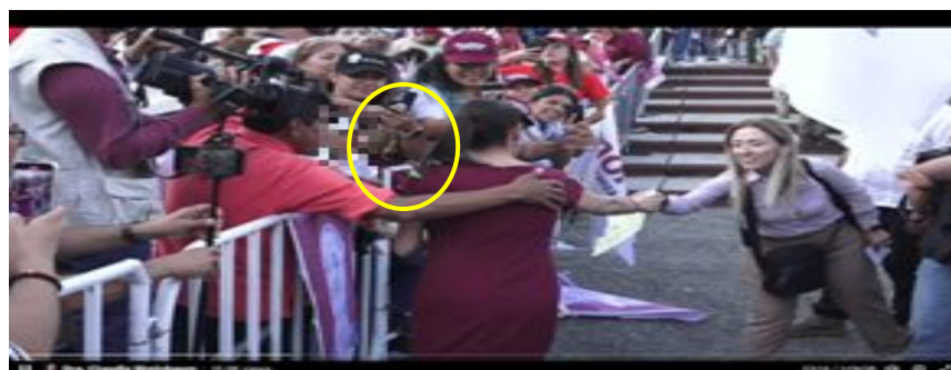
Imagen 20 Minuto 23:14

*Cuyo rostro fue difuminado por esta autoridad y así salvaguardar su imagen.