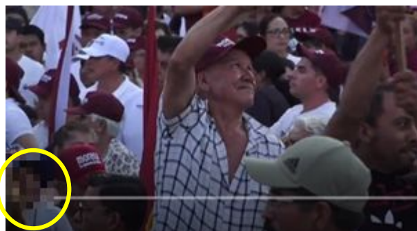
Imagen 26 Minuto 12:38

*Cuyo rostro fue difuminado por esta autoridad y así salvaguardar su imagen.