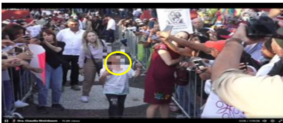
Imagen 3 Minuto 3:08

*Cuyo rostro fue difuminado por esta autoridad y así salvaguardar su imagen.