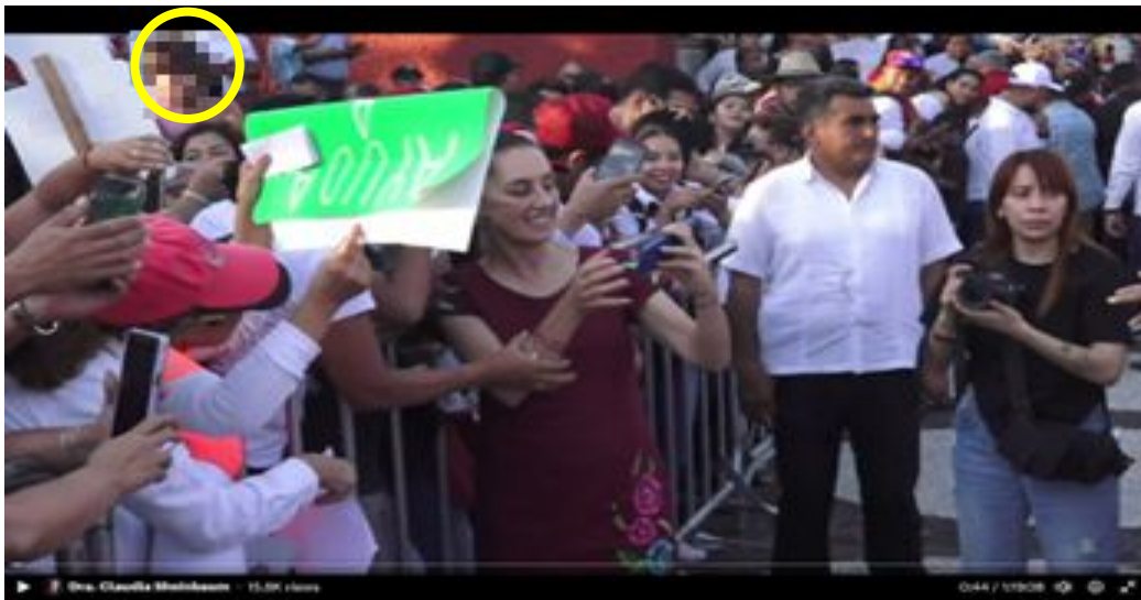
Imagen 1 Minuto 0:44

*Cuyo rostro fue difuminado por esta autoridad y así salvaguardar su imagen.