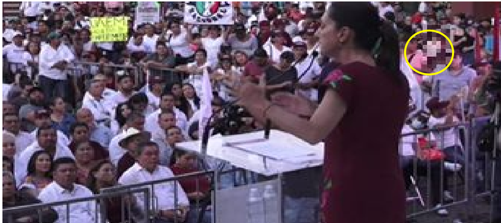
Imagen 31 Minuto 1:02:30

*Cuyo rostro fue difuminado por esta autoridad y así salvaguardar su imagen.