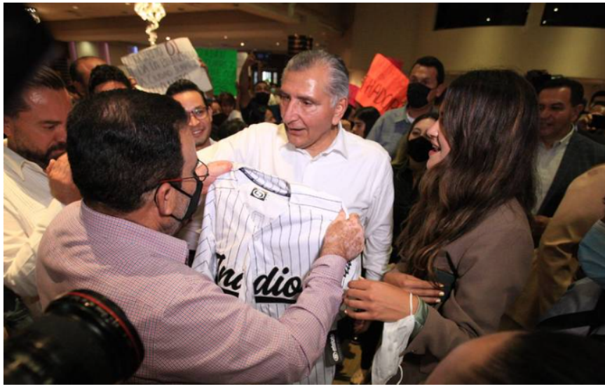
El secretario de gobernación Adán Augusto López dio una conferencia de prensa después de terminar el evento en Cibeles a los medios de comunicación.