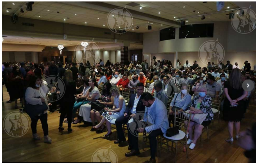
Asistentes a la conferencia

Ciudad Juárez— Cientos de personas, entre funcionarios y ciudadanos de diversas colonias que llegaron a bordo de camiones, aguardan la llegada del secretario de Gobernación, Adán Augusto López, en el centro de convenciones Cibeles en donde esta tarde impartirá la conferencia Municipios y Política Interior de la 4T.