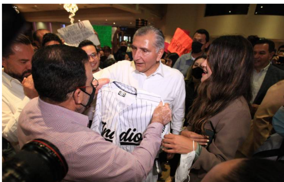
El secretario de gobernación Adán Augusto López dio una conferencia de prensa después de terminar el event en Cibeles a los medios de comunicación.

“Lo que se ve no se juzga o no se se pregunta”, así contestó el Secretario de Gobernación Adán Augusto López Hernández al cuestionamiento si contendrá por la presidencia de la república