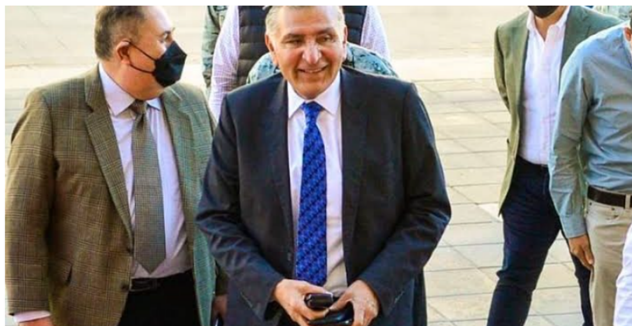
Adán Augusto realiza gira de trabajo en Chihuahua