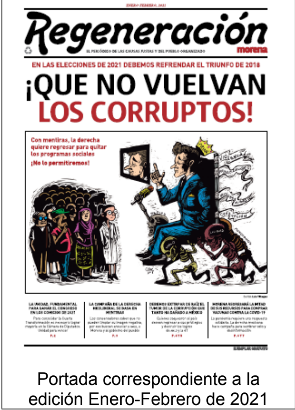
Portada correspondiente a la edición Enero-Febrero de 2021

iii) La impresión de dichas publicaciones, ha sido llevada a cabo a través de cinco contratos que el Comité Ejecutivo Nacional de