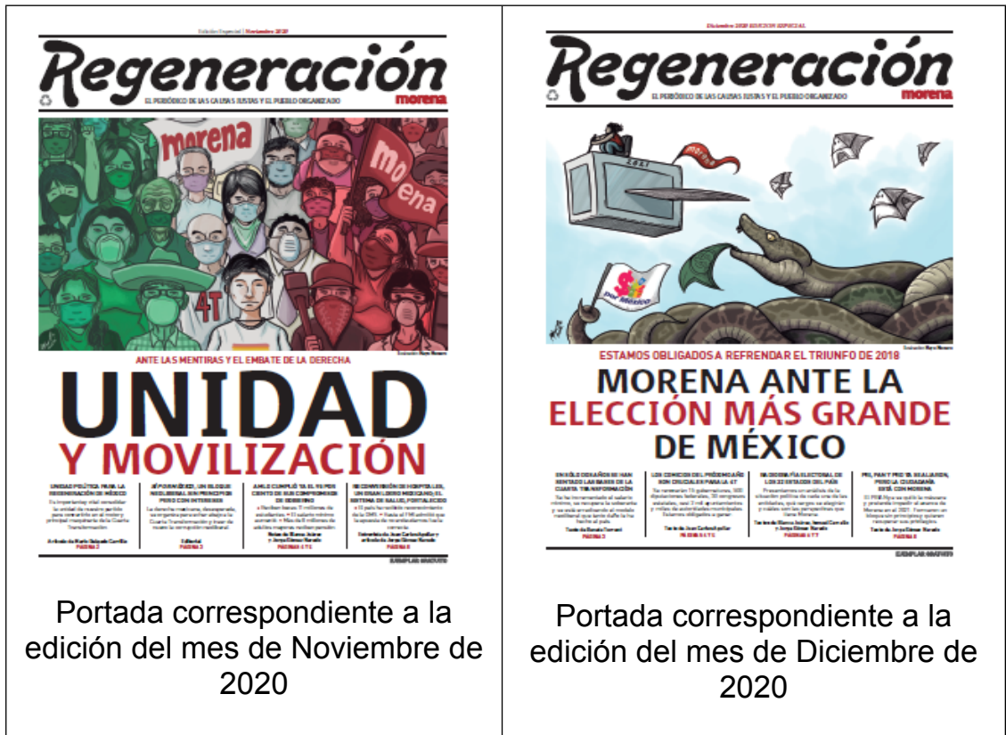
Portada correspondiente a la edición del mes de Noviembre de 2020