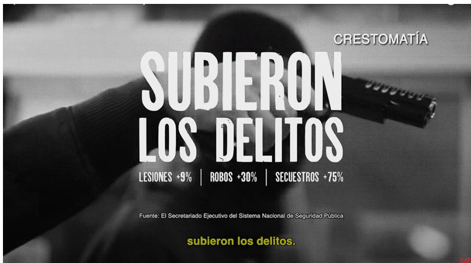
Con Delfina en Texcoco subieron los delitos.