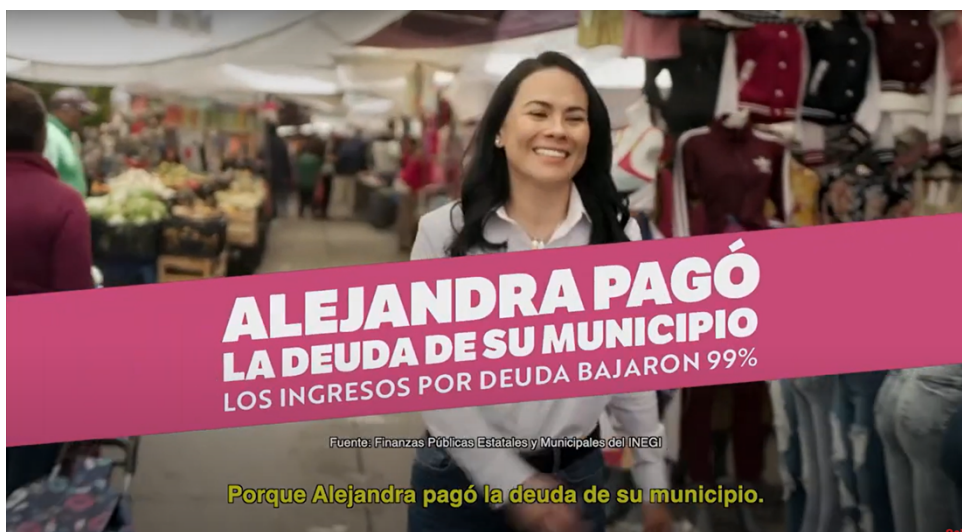
Porque Alejandra pagó la deuda de su municipio.