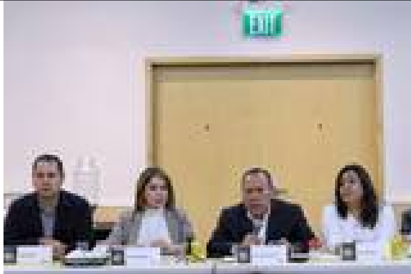
Jesús Zambrano, líder del PRD.

“Hasta nos han dicho. Sin el PRD no habría una alianza de centro progresista o centro izquierdo, por lo que habrá que ir evaluando que pasa. Nosotros deseamos con mucha sinceridad y responsabilidad que esto no derive en una ruptura”.