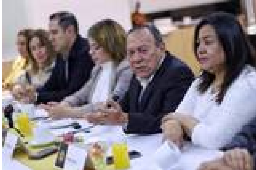
Jesús Zambrano, líder del PRD.