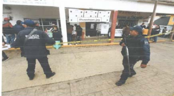
Elecciones Ahuazotepec

Grupo armado irrumpe en casillas instaladas