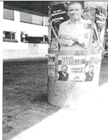
Imagen que se afirma corresponde a la que anexó el promovente en su escrito de queja.

Av. División del Nte. 3640, San Pablo Tepetlapa, Coyoacán, 04620 Ciudad de México, CDMX