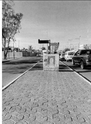
Camellón Av. Tenixtepec (a la altura de hotel Raldos), coordenadas UTM: 20.586506,-101.189247.