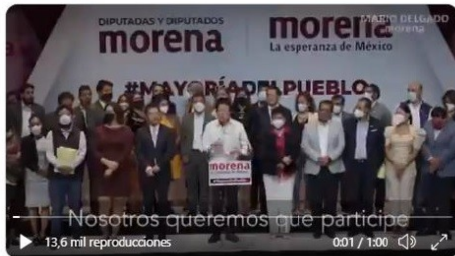
6:10 p. m. · 17 jul. 2021 · Twitter for iPhone

En relación con lo anterior, esta Sala Superior considera que los motivos de inconformidad del PAN son inoperantes porque el partido recurrente no combate los fundamentos y razones expresados por la Comisión para negar las medidas cautelares solicitadas.