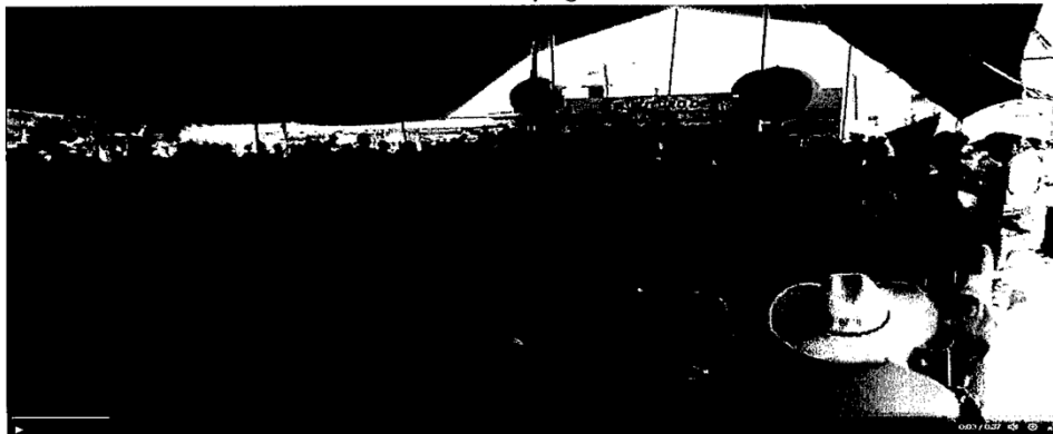
Gritos de la multitud: Presidente, presidente...