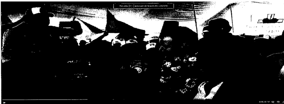
Servir con lo que mucho esfuerzo y trabajo a Construido el presidente de la República Mexicana como es la pensión de los adultos mayores.