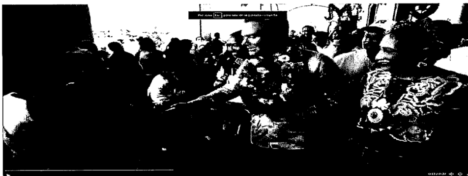
Como son las becas Benito Juárez, como son los programas sembrando vidas.