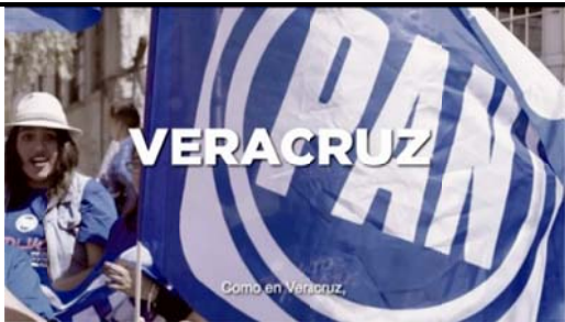
Voz en off: Como en Veracruz,