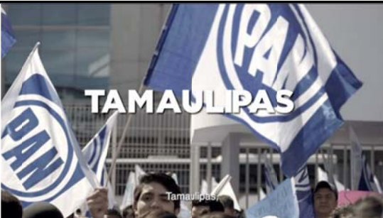
Voz en off: Tamaulipas,