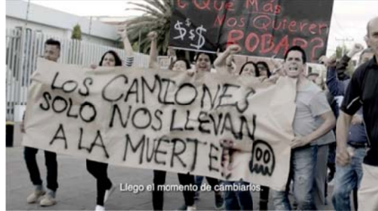
Voz en off: Llego el momento de cambiarlos.