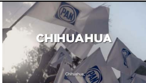
Voz en off: Chi hua hua