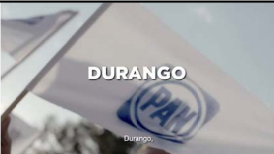
Voz en off: Durango,