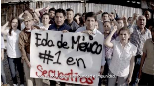
Voz en off: con su corrupción, inseguridad e impunidad.