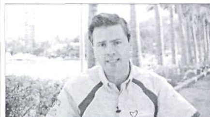
Es una gente con experiencia acreditada...