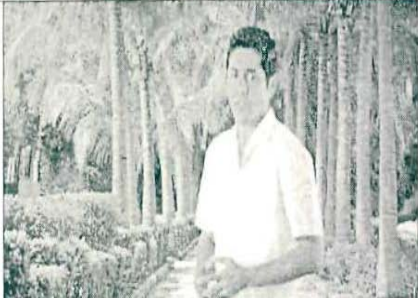
Está trabajando en diversos programas para nuestras familias y quienes nos visitan se sientan seguros...