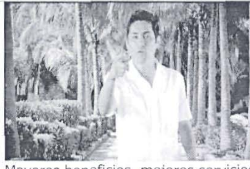
Mayores beneficios, mejores servicios...