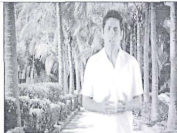
Para que nuestros niños tengan una educación digna...