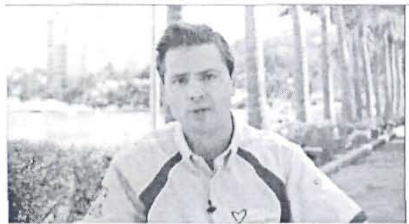
Más salud para guerrero...