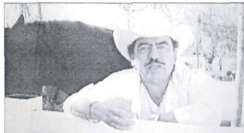
Yo confió en él, porque ha demostrado su capacidad su entrega...