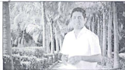
Para que reciban la atención médica que merecen...