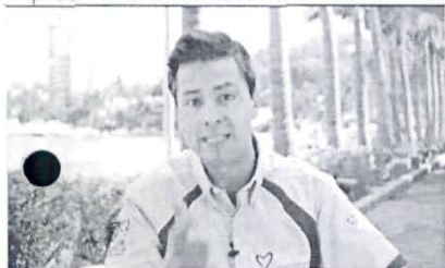
Compromete más empleo para guerrero...más educación para guerrero