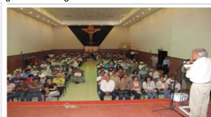
La foto que causó críticas en las redes sociales.