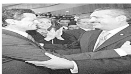
ENRIQUE PEÑA NIETO. Durante la sesión, Peña Nieto se dedicó a saludar a Peña Nieto, lo cual provocó comentarios de "debilidad" entre los presentes.

El ex gobernador del Estado de México planteó que al interior de su partido hay muchas figuras que le merecen respeto y toda su consideración. Peña Nieto se refirió también a la designación pendiente de tres consejeros electorales para el IFE. Expresó su deseo de que cuanto antes los partidos políticos encuentren los mecanismos o la fórmula que les permita definir esa terna, porque mientras tanto se deja al árbitro electoral 'en una condición todavía de debilidad'. Sin embargo, dijo que esto no impide que al actual Consejo General del IFE continúe su trabajo."