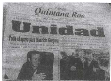
Imagen 2. Sección La ciudad, del periódico “POR ESTO! QUINTANA ROO”.

Asimismo, en dicho rotativo en comento, se observa en la sección La ciudad página 1 , a blanco y negro la imagen de los ciudadanos Roberto Borge Angulo y José Mauricio Góngora Escalante, abrazados, ambos mostrando el pulgar hacia arriba, y en el encabezado de la imagen se observa el texto siguiente: “La mejor estrategia es saber escuchar y saber sumar a todos, destaca Mauricio Góngora Escalante” “Unidad”. “*Ahora sí puedo decir que soy el precandidato de mi Gobernador Roberto Borge Angulo y de miles de priistas quintanarroenses, asegura el abanderado del PRI a la gubernatura del Estado”; El Estado 5, asimismo, en la parte inferior de dicha imagen se lee lo siguiente: “Mauricio Góngora Escalante agradeció el respaldo del Gobernador Roberto Borge Angulo y de miles de priistas, a quienes estará sumando en su periodo de precampaña. (Foto POR ESTO!)”.