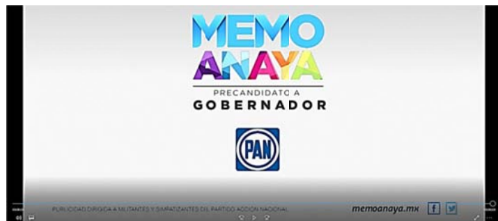
“Publicidad dirigida a militantes y simpatizantes del Partido Acción Nacional.”