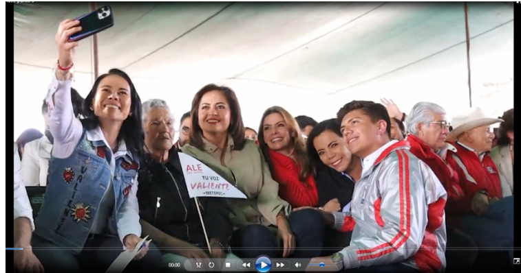
Imágenes que se desprenden del contenido del video y están detalladas en el Acta Circunstanciada 141/2023 levantada por la Oficialía Electoral del IEEM