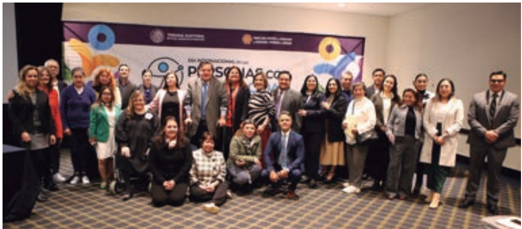
Día Internacional de las Personas con Discapacidad, 30 de noviembre de 2023.

Con esta acción se visibilizó el tema de las personas con discapacidad y los mecanismos de accesibilidad a la justicia electoral para el pleno ejercicio de sus derechos político-electoral. Asimismo, se fortalecieron los mecanismos institucionales del TEPJF para la resolución de los conflictos electorales con una perspectiva inclusiva y se posicionó al Tribunal como una institución aliada a este grupo, que por tantos años ha carecido de visibilidad y apoyo.