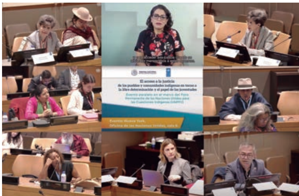
Actividad "El acceso a la justicia de los pueblos indígenas", 19 de abril de 2024.

Es así como, de 2016 a 2022, la DPEPCI cumplió con la misión de brindar gratuitamente los servicios de defensa y asesoría electorales en favor de los pueblos, las comunidades indígenas o alguna de las personas que los integren, y cuyo desglose de actividades se aprecia en el cuadro 5.