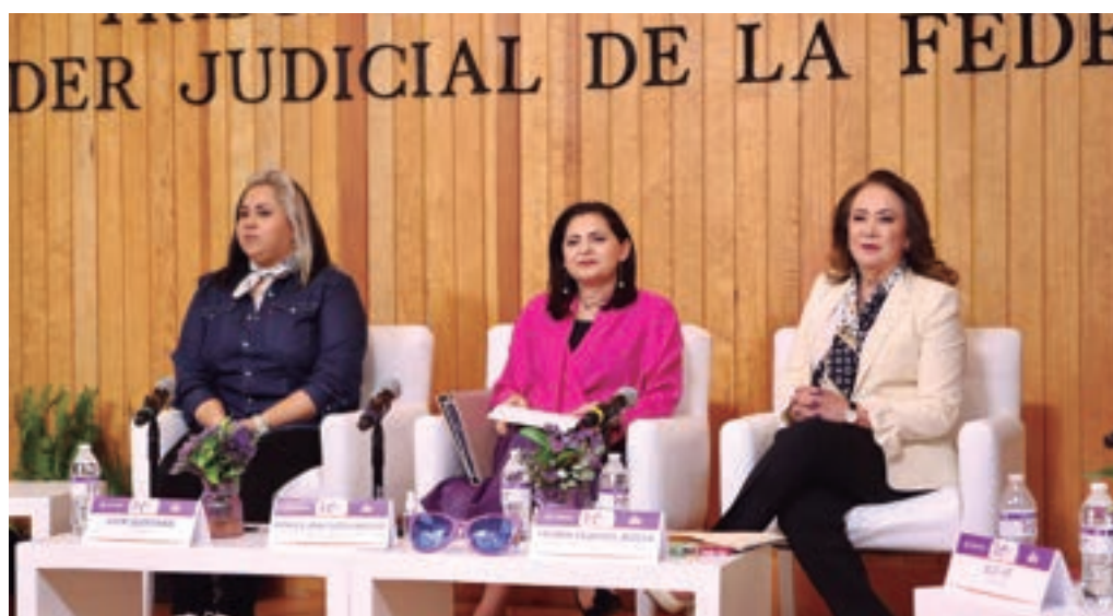
Conversatorio Musical Mujeres, Música y Letra, 12 de marzo de 2024.

Por otra parte, se fortaleció la política institucional por medio de acciones que buscan garantizar la igualdad sustantiva entre las mujeres y los hombres, la paridad y la no discriminación.