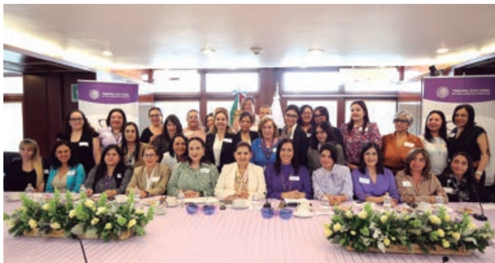
Diálogos Violeta, instalaciones de la Sala Superior, 11 de abril de 2024.

ciertas políticas públicas o atender problemas específicos. Hasta el momento se han realizado 2 encuentros: los Diálogos Violeta, el 4 de abril de 2024, con directoras generales, la titular de la Defensoría Pública Electoral (DPE) y la Subsecretaría de Acuerdos del TEPJF, y el 11 de abril de 2024, con las jefas de unidad y las directoras de área del TEPJF. Las asistentes a dichos encuentros expresaron su interés en participar en una Red de Mentoraje del TEPJF (como mentoras y mentorandas), así como integrarse a los programas Círculos de Mujeres, Democracia Paritaria y Liderazgo y Las Gafas Violeta —en este último, como promotoras—.