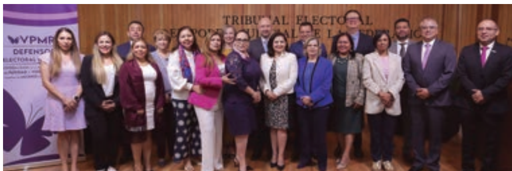
Sesión de instalación de la Defensoría Pública Electoral Especializada en la Atención de Asuntos de Violencia Política en Razón de Género, 2 de mayo de 2024.

La Defensoría responde a las experiencias institucionales en la atención de las problemáticas de las mujeres que siguen viviendo la desigualdad, la discriminación, los obstáculos en la aplicación del principio constitucional de paridad y dentro de los partidos políticos, así como la violencia en razón de género.