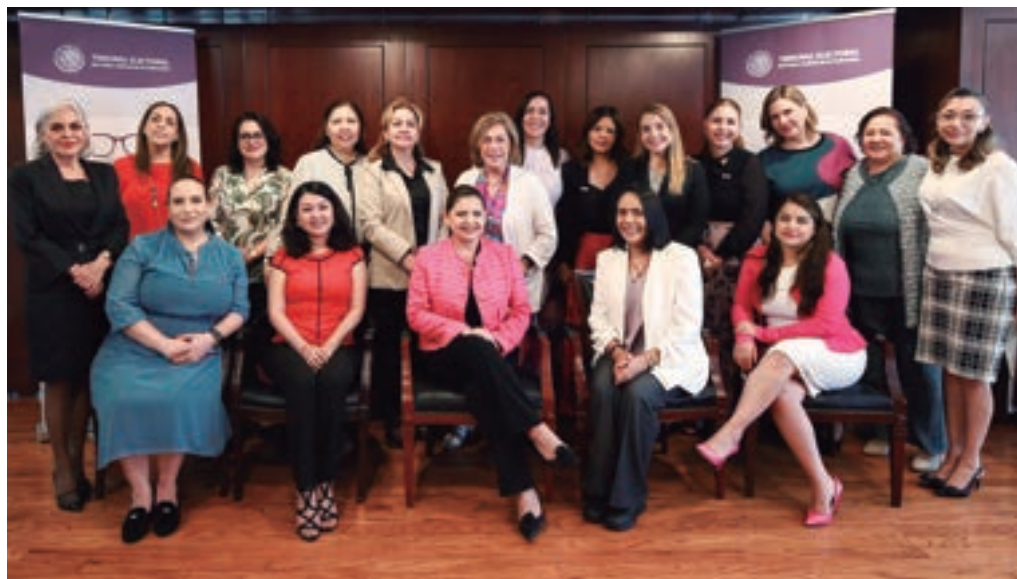
Charla Sororaria, instalaciones de la Sala Superior, 30 de mayo de 2024.

Esta actividad permite la vinculación de mujeres de distintos sectores para ampliar la discusión respecto de la ruta que deben seguir desde la sororidad, considerando los temas de interés de las mujeres desde el ámbito de los derechos político-electorales.