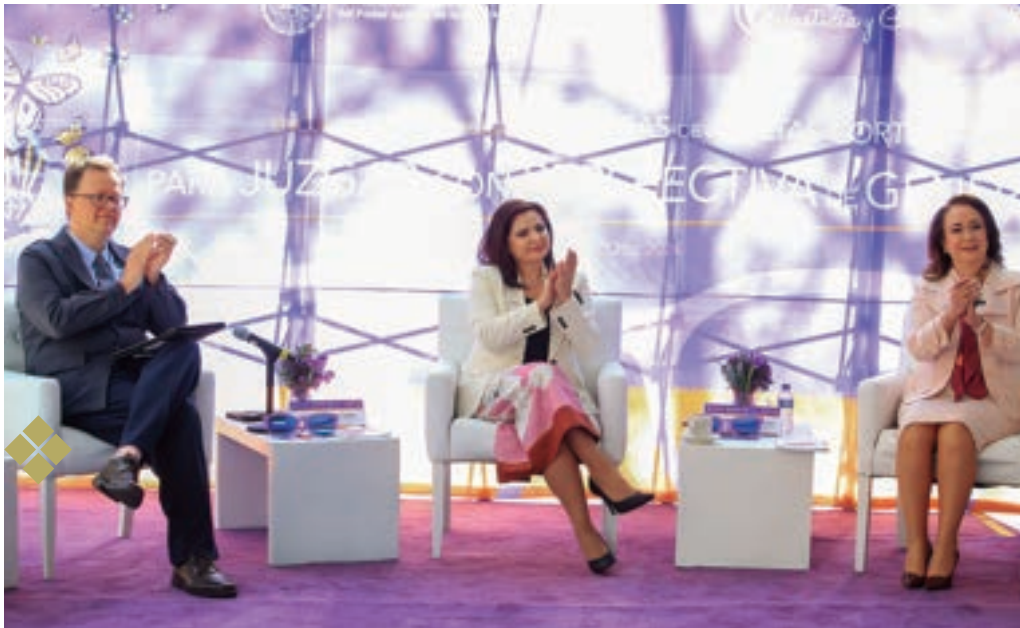
Encuentro Internacional de Juezas de las Altas Cortes para Juzgar con Perspectiva de Género, 4 de marzo de 2024.

Esta actividad buscó promover el aprendizaje entre pares, basado en las prácticas de las juezas y los jueces en la impartición de justicia electoral con perspectiva de género, a fin de ampliar las herramientas y el uso del método de la perspectiva de género, además de consolidar la formulación de decisiones judiciales que garanticen los derechos de las mujeres y de otros grupos históricamente desaventajados por razones sexogenéricas.