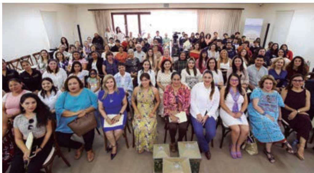
Segundo Encuentro de Mujeres del Mar, 16 de mayo de 2024.

En este foro se contó con la participación de panelistas internacionales y mujeres del mar de diversas entidades federativas, como Sonora, Baja California, Baja California Sur y Sinaloa. Durante sus deliberaciones, se buscó continuar fortaleciendo el desempeño de una justicia electoral con perspectiva de género y de igualdad de derechos mediante la difusión de criterios, sentencias, tesis y jurisprudencias en materia de derechos político-electorales con perspectiva de género e interseccionalidad.