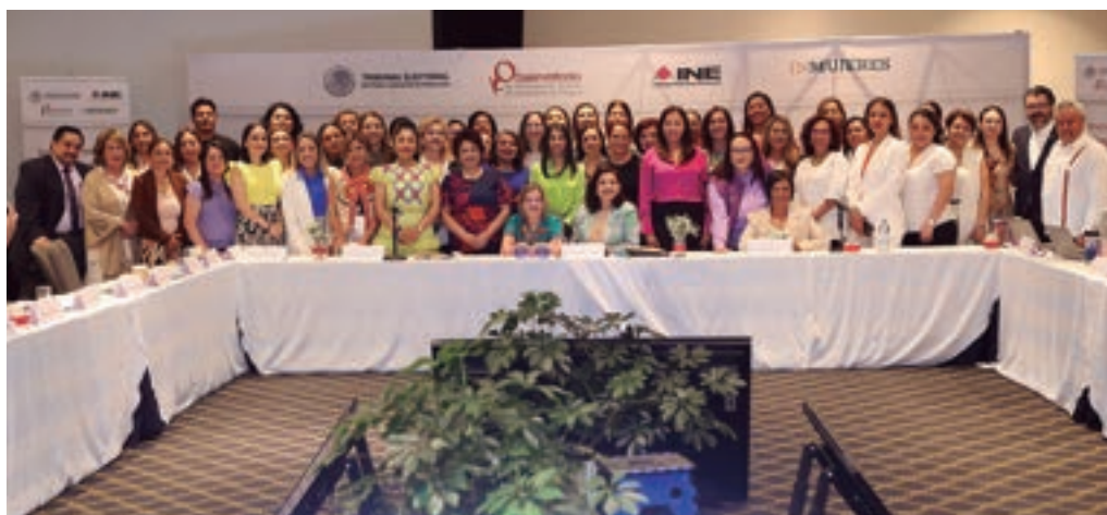
Encuentro Nacional de Observatorios de Participación Política, 24 de mayo de 2024.

Con lo anterior, el TEPJF se consolida como un tribunal abierto, incluyente y cercano a la ciudadanía, que tutela los derechos político-electorales con perspectiva de género, sin discriminación y libre de violencia política. En ese sentido, la vinculación estratégica del TEPJF con los organismos y las autoridades electorales en los ámbitos federal y local permitió fortalecer la implementación de la justicia electoral con perspectiva de género.