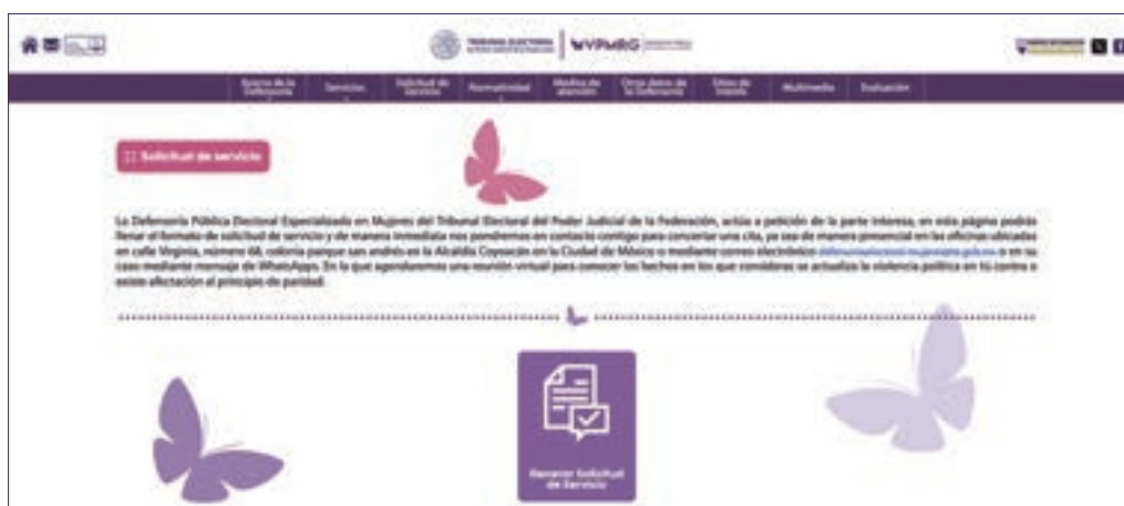
Figura 1. Imagen de la página de internet de la Defensoría Pública Electoral, en la que se puede realizar la solicitud de servicio y su evaluación