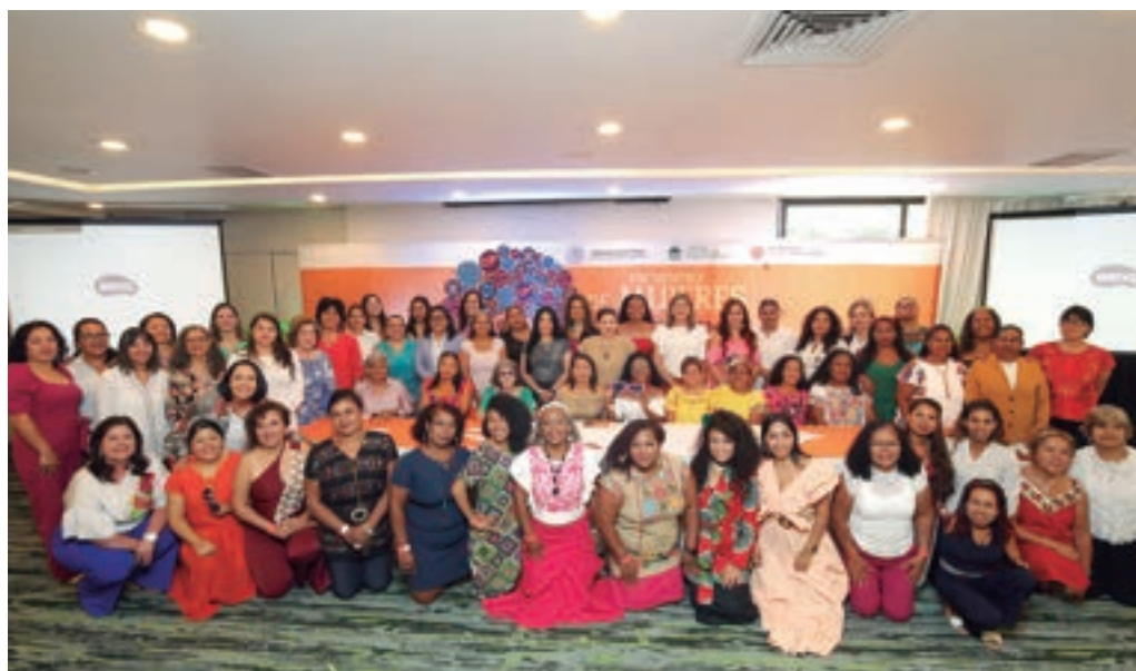
Encuentro de Mujeres Afrodescendientes Afromexicanas, 7 de mayo de 2024.

El TEPJF tuvo el objetivo de conducir a la reflexión para dar paso a la acción respecto a la promoción del acceso a la justicia electoral, considerando el contexto de las personas para el ejercicio de los derechos político-electorales de las mujeres y los hombres en condiciones de igualdad. En el caso, focalizó su atención en las poblaciones históricamente vulneradas, como las mujeres afromexicanas y afrodescendientes.