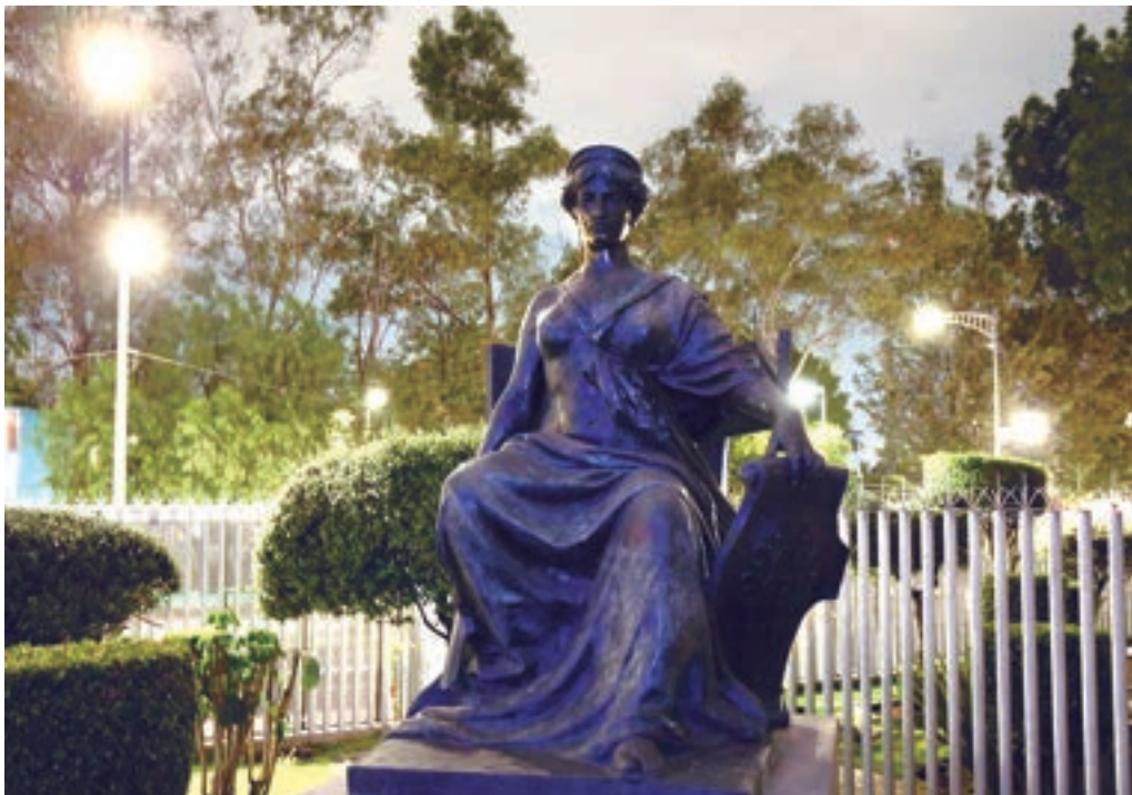
Imagen de la justicia, Sala Superior del Tribunal Electoral del Poder Judicial de la Federación.

Para lograr ese cometido, se realizó un trabajo articulado entre las diversas unidades del TEPJF, con el objetivo de interiorizar, como principio rector, la justicia con lentes violeta; esto es, todas las áreas, jurisdiccionales y administrativas, enfocan sus esfuerzos en lograr una actuación en condiciones de igualdad y paridad, al colocar la dignidad de la persona en el centro del actuar institucional.