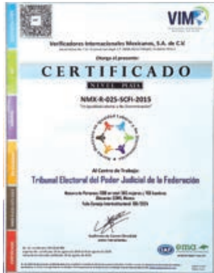
Entrega de la certificación en la Norma Mexicana NMX-R-025-SCFI-2015, 23 de septiembre de 2024.